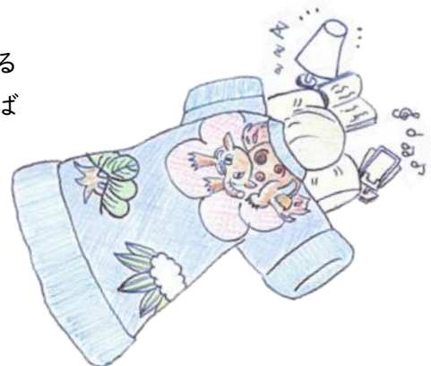
獺模様の夜着 画：岡松 恵