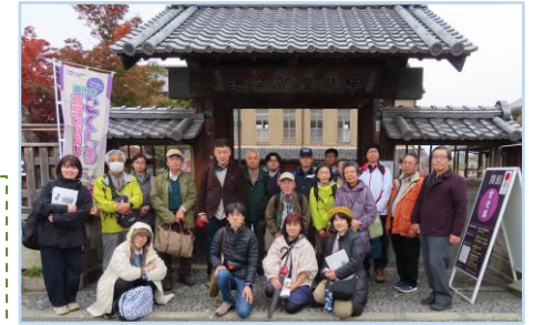
2025-2学期 文化資源としての景観