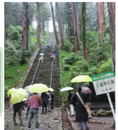
2025-1学期 現代からみる仏教