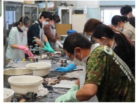
2025-2学期 袴すゝ服飾の原点の技法

聴講できる科目・・・担当講師の了解のもと、本学が指定した科目に限ります。追加登録受付期限日後、空席のある科目のみ募集します。