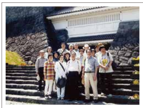
ゆうがくの会ミニ研修旅行

ゆうがくの会は、会員相互の親睦と交流をはかり、学習成果の向上に資する為に平成8年9月に発足しました。現在68名が加入しております。