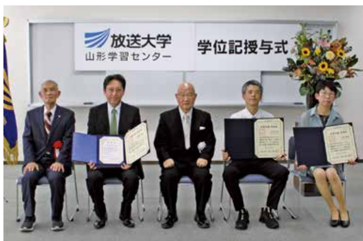
学位記授与式を終えての集合写真