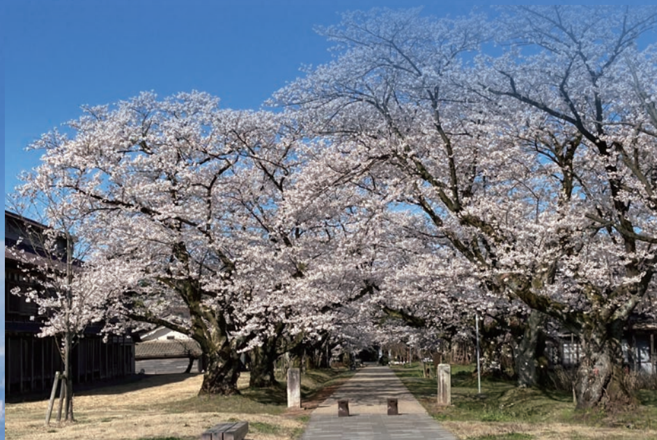
日本遺産 松ヶ岡開墾場