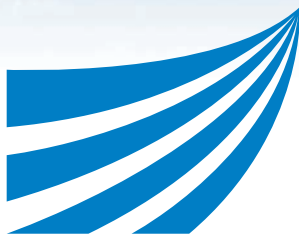
放送大学シンボルマーク (制作 永井一正氏)