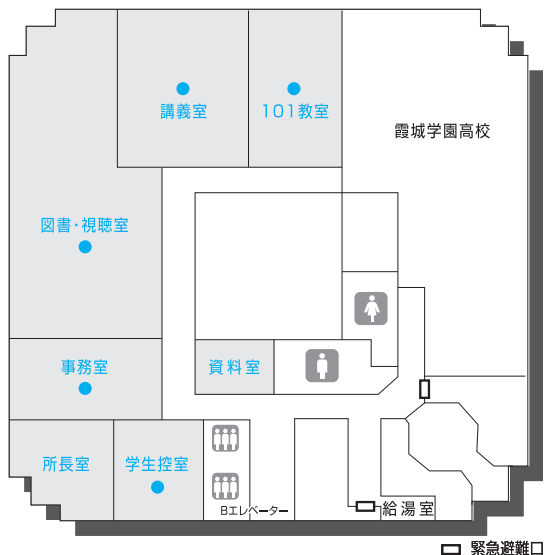
〔 霞城セントラル 10階平面図 〕

※ 自家用車で来所する方は近隣の駐車場（最終ページ参照）を利用してください。 学習センターの利用による駐車料金の割引等はありません。