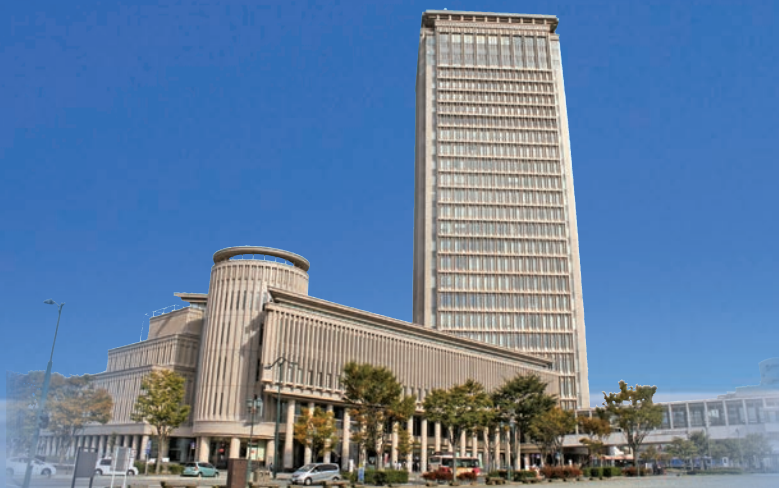
霞城セントラル(山形駅西／放送大学山形学習センター所在)