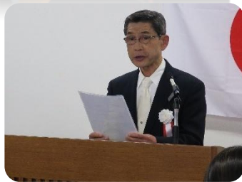
学窓会副会長祝辞