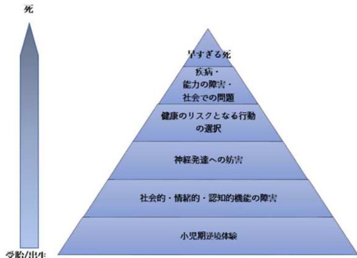
図 小児期逆境体験が健康や寿命に及ぼすメカニズム：ACEピラミッド

こういったさまざまな社会問題や健康リスクが増えていき、最終的には早期の死を迎えかねないといったことについて示しているのが、ACEピラミッドといわれるものです。