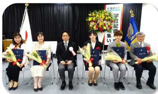
2023年度第2学期卒業生の皆さん