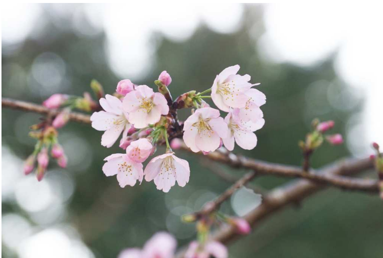
オオカンザクラ(大学会館南側、3月中旬)