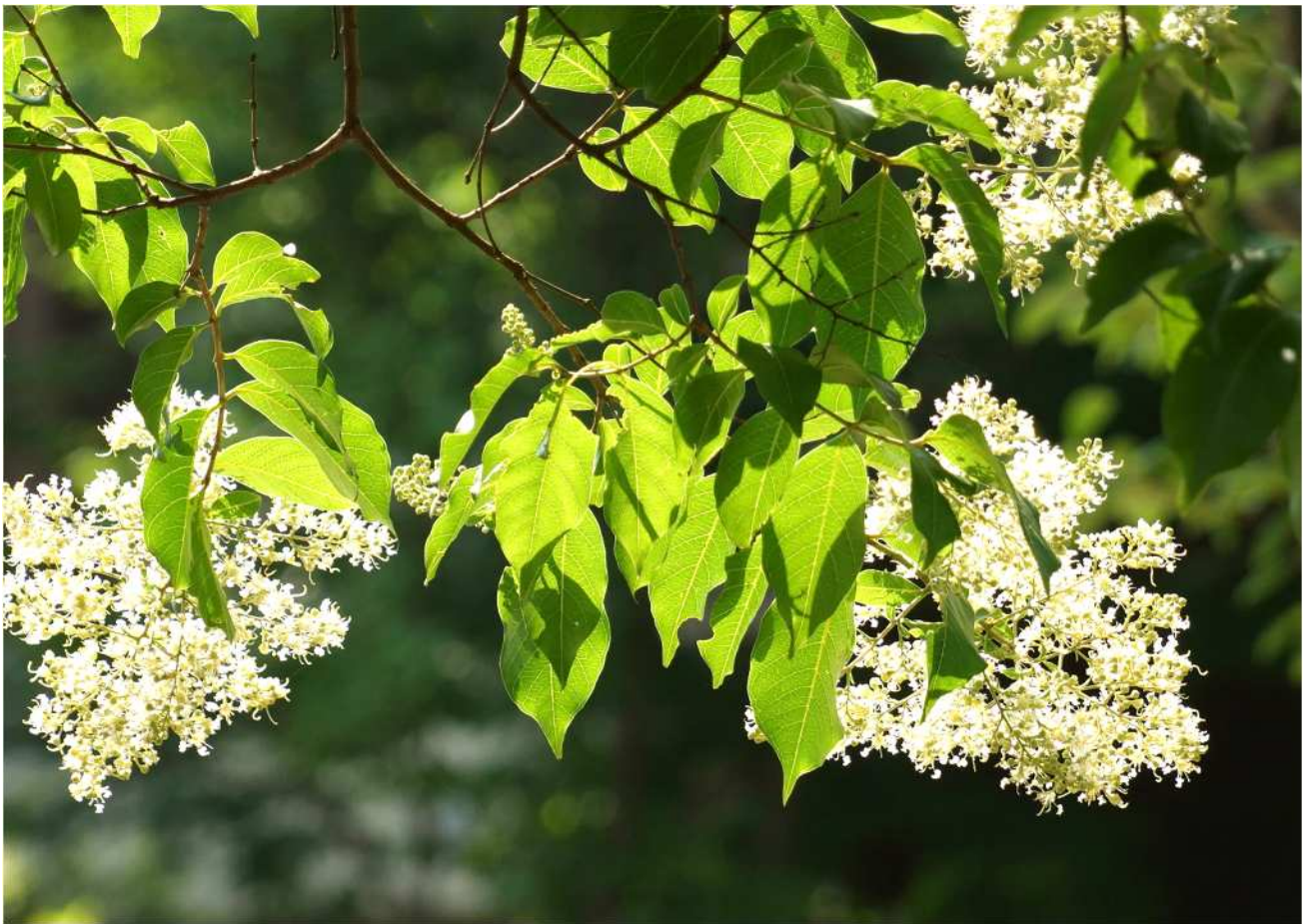
サルスベリ(宇都宮大学構内)