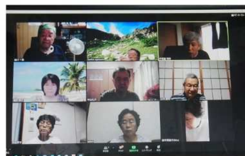
令和2年度 第1回浜松同窓会・役員会 令和2年8月3日(月) 午後1時30分~3時45分

会員は、普段からフェイスブック等を利用して交流を図っており、オンライン飲み会や喫茶室も開いています。自宅に居ながら親睦を深め、それぞれの得意な情報交換もできます。飲み会をしながら自分磨きもできる、今後もますます楽しい同窓会です。