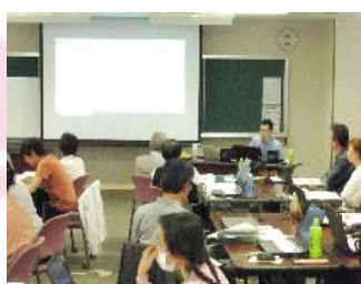
【面接授業：新・初歩からのパソコン】

入学生の内訳は、学部生の全科履修生が169名(昨年同期比1名増)、大学院の修士全科生が8名(昨年同期比1名減)と全科生については、ほぼ横ばいの状況でした。しかし、学部の選科・科目履修生等の大幅な減少で、全体では625名(昨年同期比65名減)となりました。