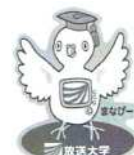
放送大学オリジナルバッジ まなびーピンバッジ