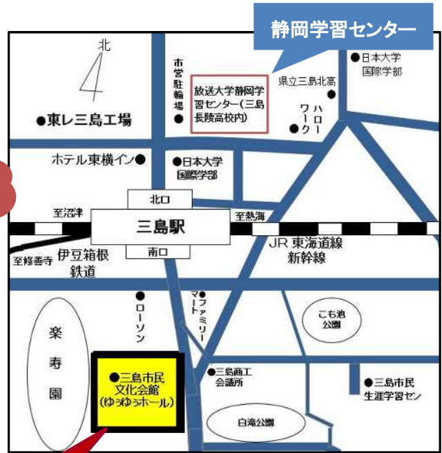
【静岡学習センター試験会場 案内図】