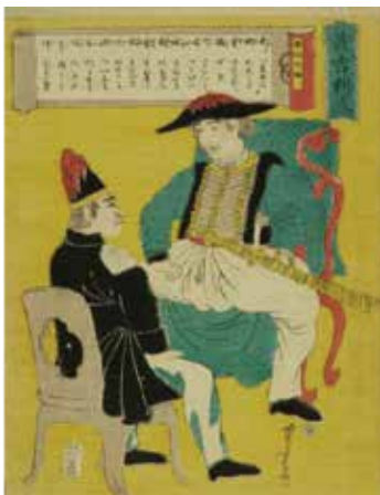
外国人物図畫 英吉利人 歌川 芳虎

つくられる染料、青色がかった黄色が特徴)であると判定しました。一方、周延(1838~1912、幕末から明治期に活躍)の浮世絵では、柱、欄干、舟のところに黄色が効果的に使用されており、柱と欄干部分では濃淡に色分けされています。すべての黄色彩色部分から、原子番号33のヒ素Asと原子番号16の硫黄Sが検出されました。このことより、こちらの浮世絵では顔料の雄黄が使用されていると判定できます。さらに、色が濃い部分と薄い部分では、ヒ素のピーク強度