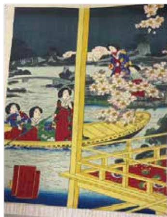
雪月花の内 [桜花遊覧] 橋本 周延

がそれぞれ約2600と1250であり、同一の顔料の量を変化させて濃淡を表現したことがわかりました。雄黄は、16世紀までのヨーロッパ絵画で多用されていましたが、その後は人工品であるクロム黄やカドミウム黄に徐々に置き換わっていったそうです。