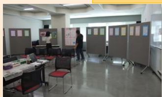
がん哲学サークル「COCON」