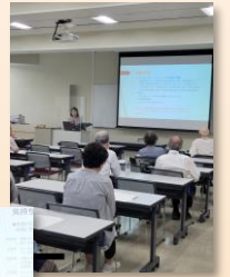
卒研・修論 発表会