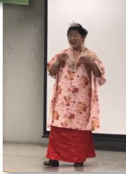
個人出演の皆さん