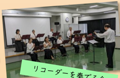
リコーダーを奏でる会