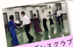
ソーシャルダンスクラブ