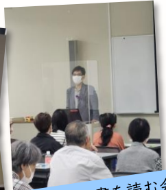
江戸時代の古文書を読む会