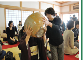
西大寺の大茶盛式

平成26年11月16日(日)、奈良同窓会主催の近畿地区交流会が開催された。近畿地区は奈良、大阪、京都、滋賀、兵庫、和歌山の6同窓会が構成される。これに連合会本部が加わり、参加者はこれまで最多の41名となった。奈良同窓会の日帰り奈良らしい交流会にという思いが皆に届いたようである。三部構成企画の第一回は、西大寺見学と大茶盛体験である。私たちは9時30分近鉄西大寺駅に集合し、西大寺に向った。西大寺は奈良時代に創建され、東の東大寺・西の西大寺と称される大寺であった。しかし平安時代、度重なる災害に遭い衰頹した。その後鎌倉時代半ば、名僧興正菩薩観音によって真言律宗の根本道場として復興された。これが原型となり、室町時