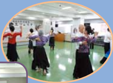
ソーシャルダンス