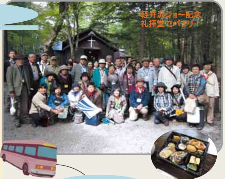
軽井沢ショー記念 礼拝堂でパチリ!

第二次世界大戦後の日本の経済成長に伴い、一般大衆がレジャーとして避暑を楽しむようになり、更に1998年の長野新幹線の開通をきっかけに、首都圏との近接性が高まり、避暑地から定住地への変化を続けている。