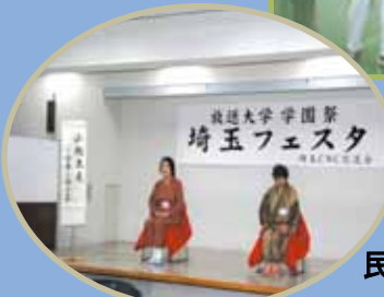
民話のお話(山椒太夫)