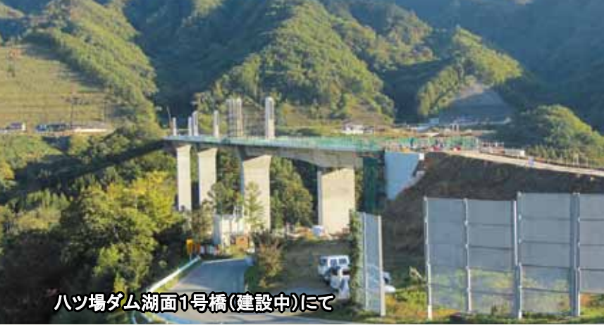
ハツ場ダム湖面1号橋(建設中)にて