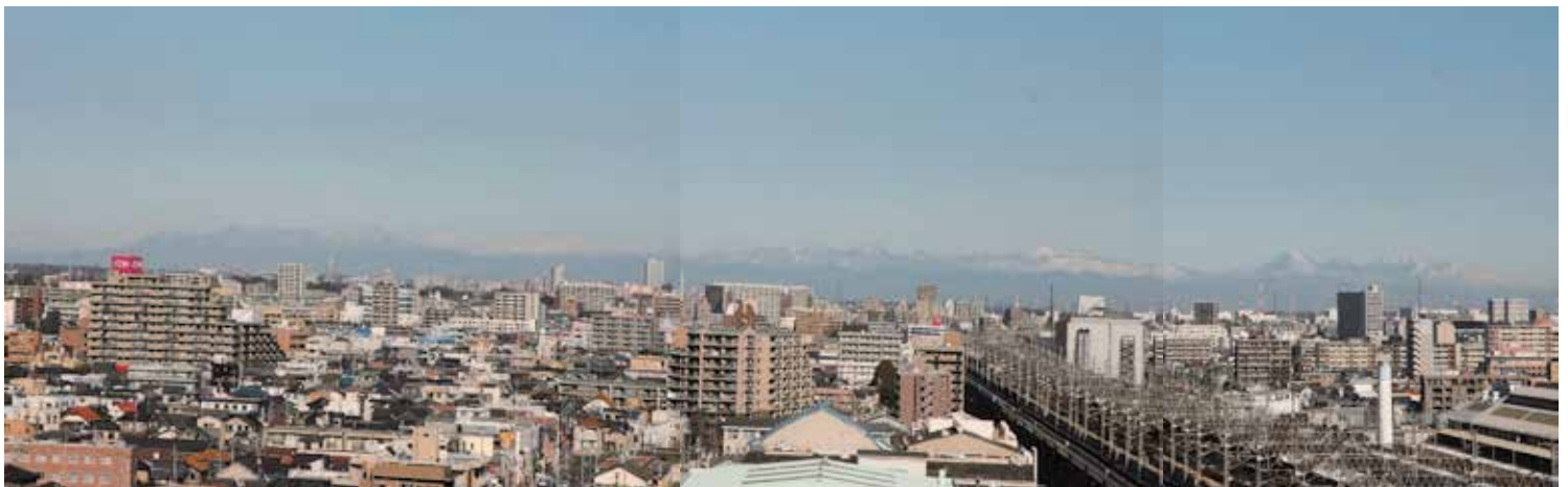
10F図書室から栃木方面を臨む

ただ、放送大学で通常に近いレベルの学習状況が維持されていると言っても、学生の皆様にとっては何かと落ち着かない社会状況の中で勉学に集中しなければならず、そのご苦勞も多いことと思います。コロナに負けず頑張っていたきたいと思っています。