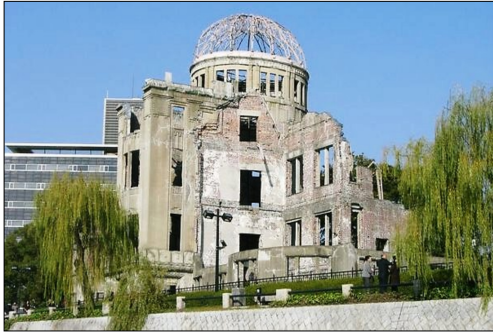
青空の下、静かに佇む原爆ドーム

67年最初の保存工事が行われた。その後も数回工事が行われ、1992年広島市長は、国に対して世界遺産登録の手続きを要請したが文化財にあらざとの理由で却下された。これに対し市民は1993年に「原爆ドームの世界遺産化を進める会」を発足させ、積極的な働きかけを行った。ここで世界遺産リスト登録に必要な推薦の5つの条件について触れておく。①遺産を保有する国が世界遺産条約の締約国であること、②あらかじめ当該国の暫定リストに記載されていること、③遺産を保有する締約国自身からの推薦であること、④登録推薦する遺産は不動産であること、⑤登録推薦する遺産が保有国の法律などで保護されていることである。1995年日本国は国の史跡に指定した。1996年メリダ市(メキシコ)第20回世界遺産委員会において世界遺産リストへの登録となった。