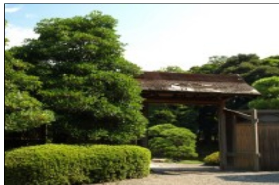
浜離宮中島の御茶屋

た。建物は北面して建てられ中央部に正面玄関をとり、左右翼屋が前方に突出した凹型平面の建物であった。身舎部分(翼屋以外の建物)は、前方(北側)に廊下をとった片廊下式とし、南側に2列に部屋を配置し、南面にベランダを設けた。両翼屋は中廊下式でその両翼に室と便所・浴室を配置している。全体の室数は24室あり、内部は廊下・室内とも絨毯敷き、主要室には暖炉が設置されていた。延遼館が当初石室と呼ばれたのは、外壁が石造りであったためである。