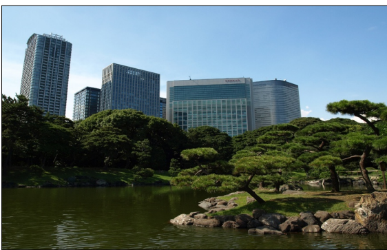
汐留のオフィス街と浜離宮

延遼館は明治初期の迎賓館として、1869年(明治2年)5月から1890年4月(明治23年)まで使用され