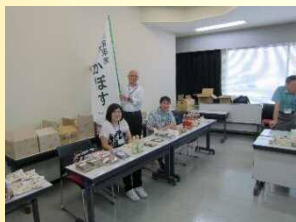
地域の名産品販売も。昨年大好評だった、秩父産商品の販売もありました。