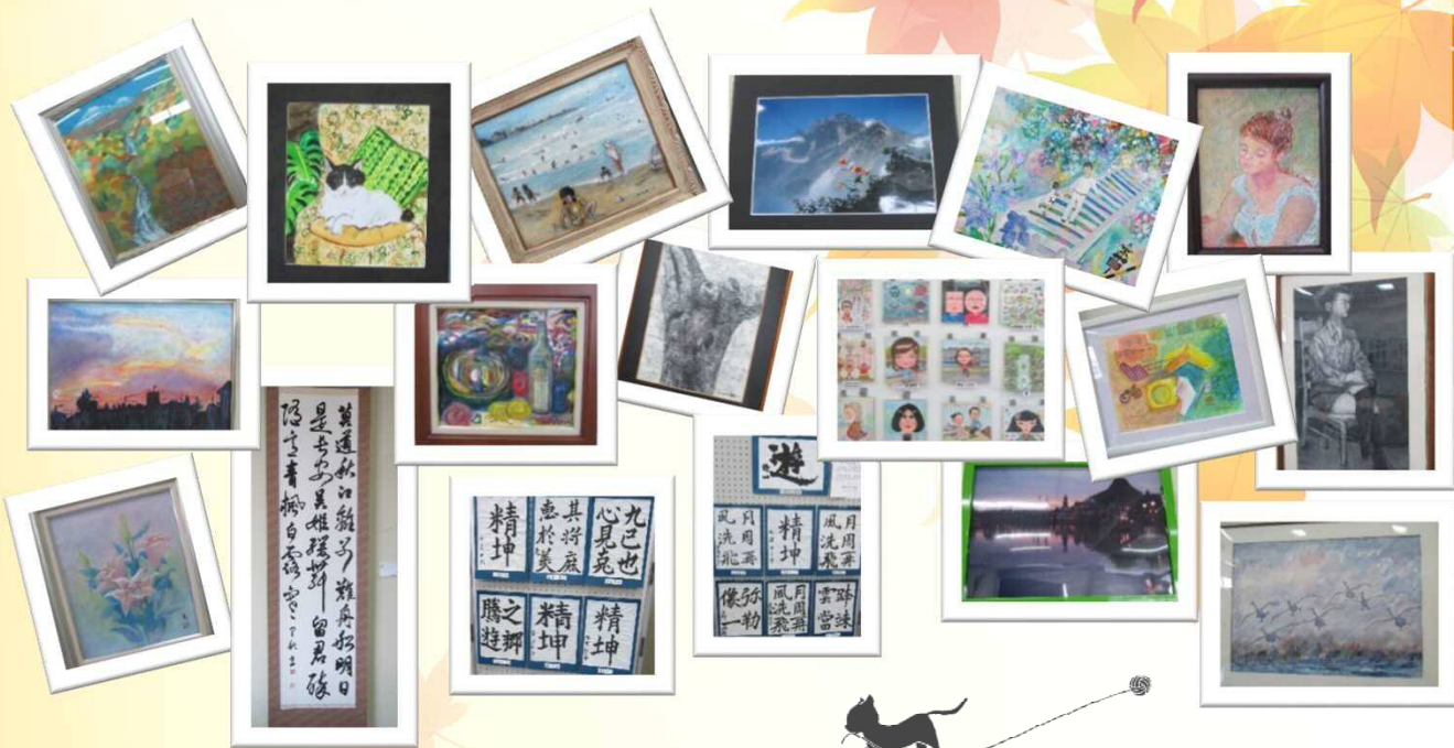
さまざまな写真、書や絵画。皆さんの創造力が光ります!

平成29年9月9日(土)・10日(日)の2日間に亘り、埼玉フェスタが開催されました。当日は絵画や書、手芸品に至るまで、学生の皆様のさまざまな作品展示、バザーや参加型イベント等、多彩な催し物で活気付きました。