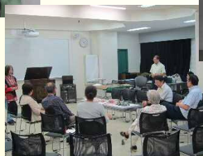
音楽を昔懐かしいレコードで 聴きます♪