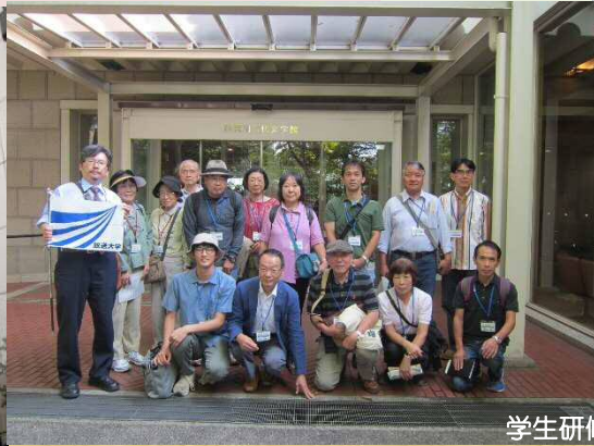
P.6 学生研修旅行(横浜)