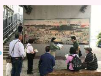
山下公園散策で歴史を学びます。