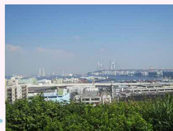
公園からベイブリッジ方面を臨みます。