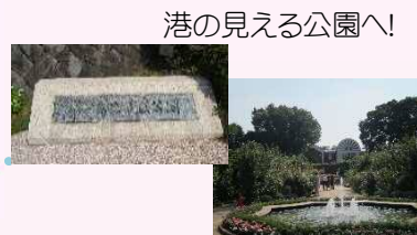
港の見える公園へ!