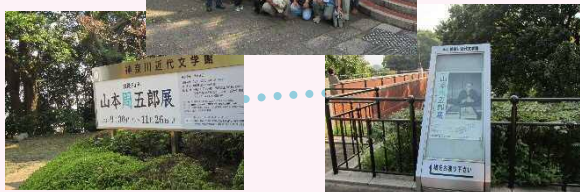
県立神奈川近代文学館。横浜に縁のある作家たちの資料が展示されています。