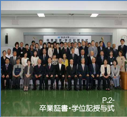
P.2- 卒業証書・学位記授与式