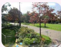
元町・中華街駅のアメリカ山公園を出発!

最高気温29℃という真夏のような陽気の下、10名の参加者と共に横浜で文学の歴史に触れる研修旅行を催行いたしました。今年の目的地は横浜という事もあり、手軽ながら学ぶべき深い歴史や文化に触れることが出来ました。