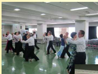
Shall We Dance? ソーシャルダンスクラブ