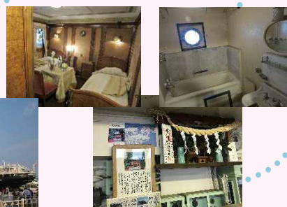
山下公園～氷川丸へ。当時の客室や大宮氷川神社との縁に触れました!