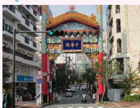
昼食を兼ねて横浜中華街へ!