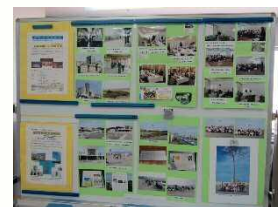
学生主体で行われた陸前高田への研修旅行の報告もありました。