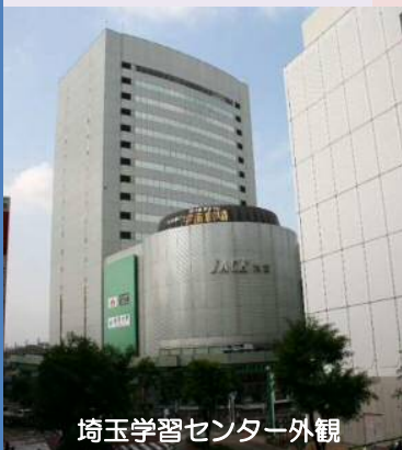
埼玉学習センター外観