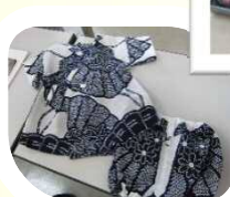
手芸や工芸品の出展も。