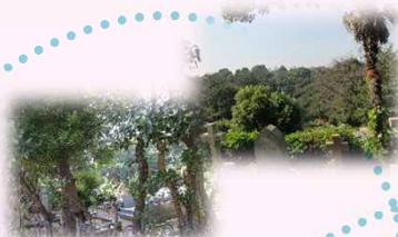
横浜山手外国人墓地の横を通り・・・