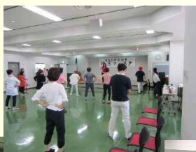
健康体操で生き活き!