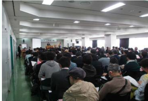
真剣に話に聴き入る新入生