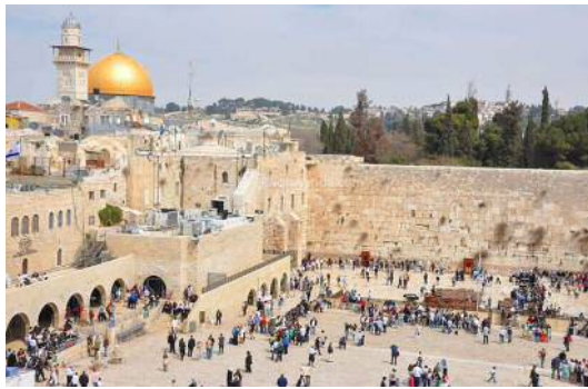
エルサレム旧市街と城壁群

紀元前千年頃、エルサレムはダビデ王によって古代イスラエル王国の首都とされた。ダビデ王の後をついだソロモンは、町の中心部にあるモリヤの丘に「十戒」を納めたエルサレム神殿を建設した。十戒は、ユダヤ教の唯一神ヤハウェがモーゼに与えたとされる戒律であり、エルサレムは政治的にも宗教的にもユダヤ人の中心となった。しかし紀元前63年エルサレムはローマ帝国の支配下に置かれ、さらに紀元後70年にローマ軍によって市街と神殿が破壊され、ヘロデ王が築いた西壁の一部だけが残された。ユダヤ人は神殿のあった丘から追放されて故国を失い、以後、世界各国に離散(Diaspora デイアスポラ)することを余儀なくされた。残された西壁はその後「嘆きの壁」としてユダヤ教徒が祈りをささげる聖地となっている。