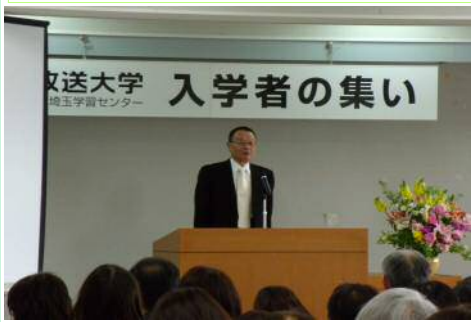
埼玉学習センター・渋谷所長の挨拶