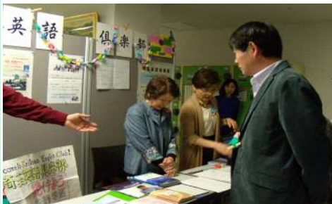
サークルは競って新入生を勧誘