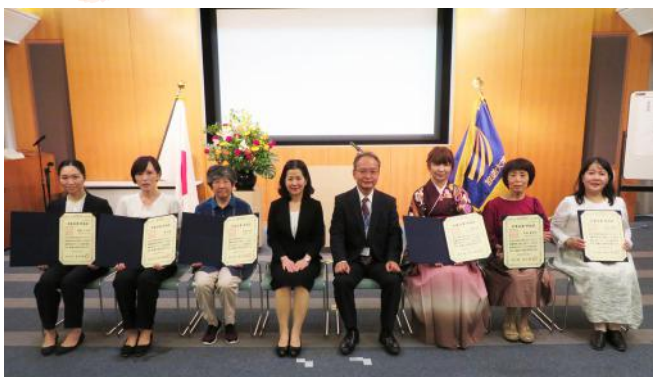
「学位記授与式」に参加された卒業生の皆さん