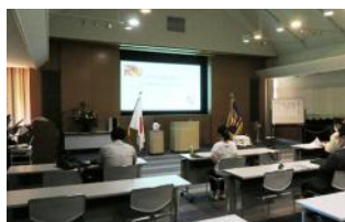
オリエンテーション