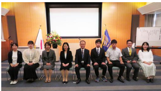
「入学者の集い」に参加された新入生の皆さん