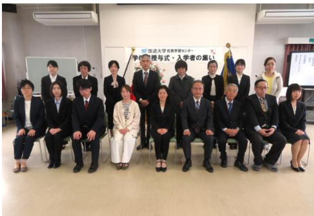
「入学者の集い」に参加された新入生の皆さん

放送大学に入学・再入学され、佐賀学習センターに所属された121名の皆さん、ご入学おめでとうございます。