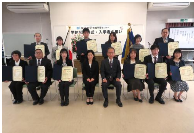
「学位記授与式」に参加された卒業生の皆さん

学びの目標を達成された皆さんが、身につけられた見識のもとに、ウクライナ侵攻や世界的経済の変調などますます混迷を深めている情勢のもとで、新しい社会の構築に果敢に挑戦されるとともに、より深遠で幅広い知識・思考力を求めて楽しい学びを継続され、皆さんの人生がより豊かになることを心より願っております。