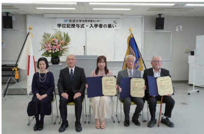
「学位記授与式」に参加された卒業生の皆さん

皆さんの未来が、学びによってさらに豊かに広がっていくことを、心から願っています。