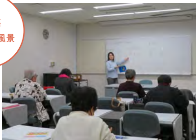
中国語勉強会の風景

佐賀学習センターでは、サークルおよびマンスリー・ゼミの受講生を募集しています。通信制の放送大学では個々での勉強がメインとなってしまいますが、サークルやマンスリー・ゼミは他の学生との交流の場でもあります。学友と学ぶ楽しさを実感してみませんか？参加をご希望の方は、佐賀学習センターまでご連絡ください♪