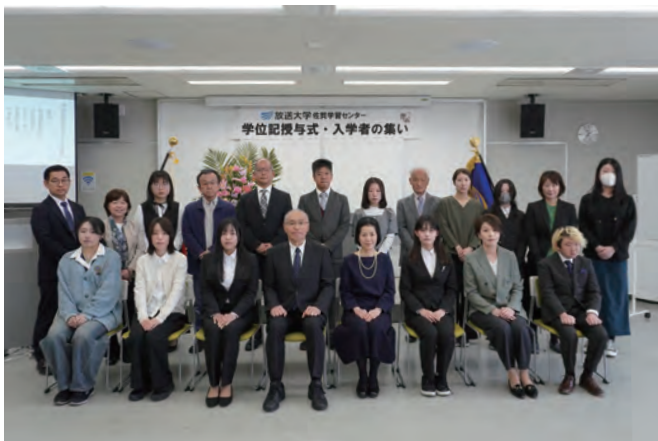
「入学者の集い」に参加された新入生の皆さん

ご入学、おめでとうございます。 放送大学に入学・再入学された134名の皆さんを、心から歓迎いたします。