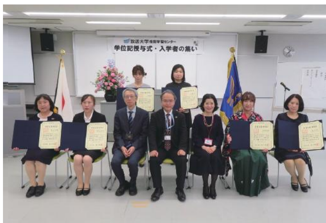
「学位記授与式」に参加された卒業生の皆さん

学びの目標を達成された皆さんが、身につけられた見識を活かされて、多様性を許容する平和で安定した豊かな社会の構築に取り組みれるとともに、より深遠で幅広い知識・思考力を求めて楽しい学びを継続され、皆さんの人生がより豊かなものになることを願っております。