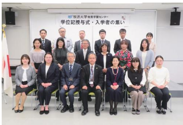
「入学者の集い」に参加された新入生の皆さん

放送大学に入学・再入学され、佐賀学習センターに所属された125名の皆さん、ご入学おめでとうございます。