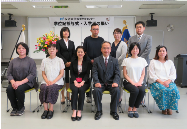
「入学者の集い」に参加された新入生の皆さん

放送大学に入学・再入学され、佐賀学習センターに所属された135名の皆さん、ご入学おめでとうございます。