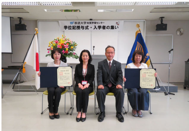
「学位記授与式」に参加された卒業生の皆さん

放送大学を卒業された13名の皆さん、新型コロナウイルスの繰り返される蔓延という厳しい状況のもとで、多くの困難に打ち勝ち「主体的な学び」を継続されて卒業に至られたことに敬意を表しますとともに、心よりお祝いの言葉を申し上げます。