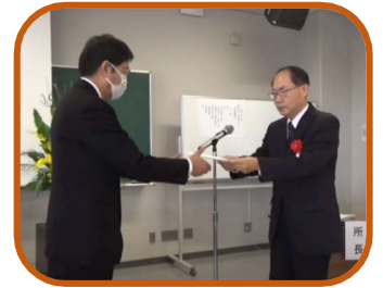
卒業生代表の答辞