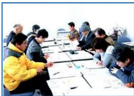
(写真) 研究会の様子

月1回の研究会(月例会)では、医療や福祉に携わる方々ばかりではなく、医療・福祉に関心のある様々な異業種の方々が集まり、自由に意見を述べ合っています。様々なテーマでの話し合いはとても刺激的です。最近では、テーマの内容も医療や福祉だけにはとどまらず、心理学やカウンセリング、教育といった広い範囲にまで広がっています。こういったテーマに関心のある方はぜひとも一度、研究会(例会)をのぞいてみてください。毎月の研究会(月例会)開催予定日時やテーマ・発表内容等については、