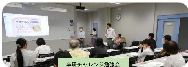
卒研チャレンジ勉強会