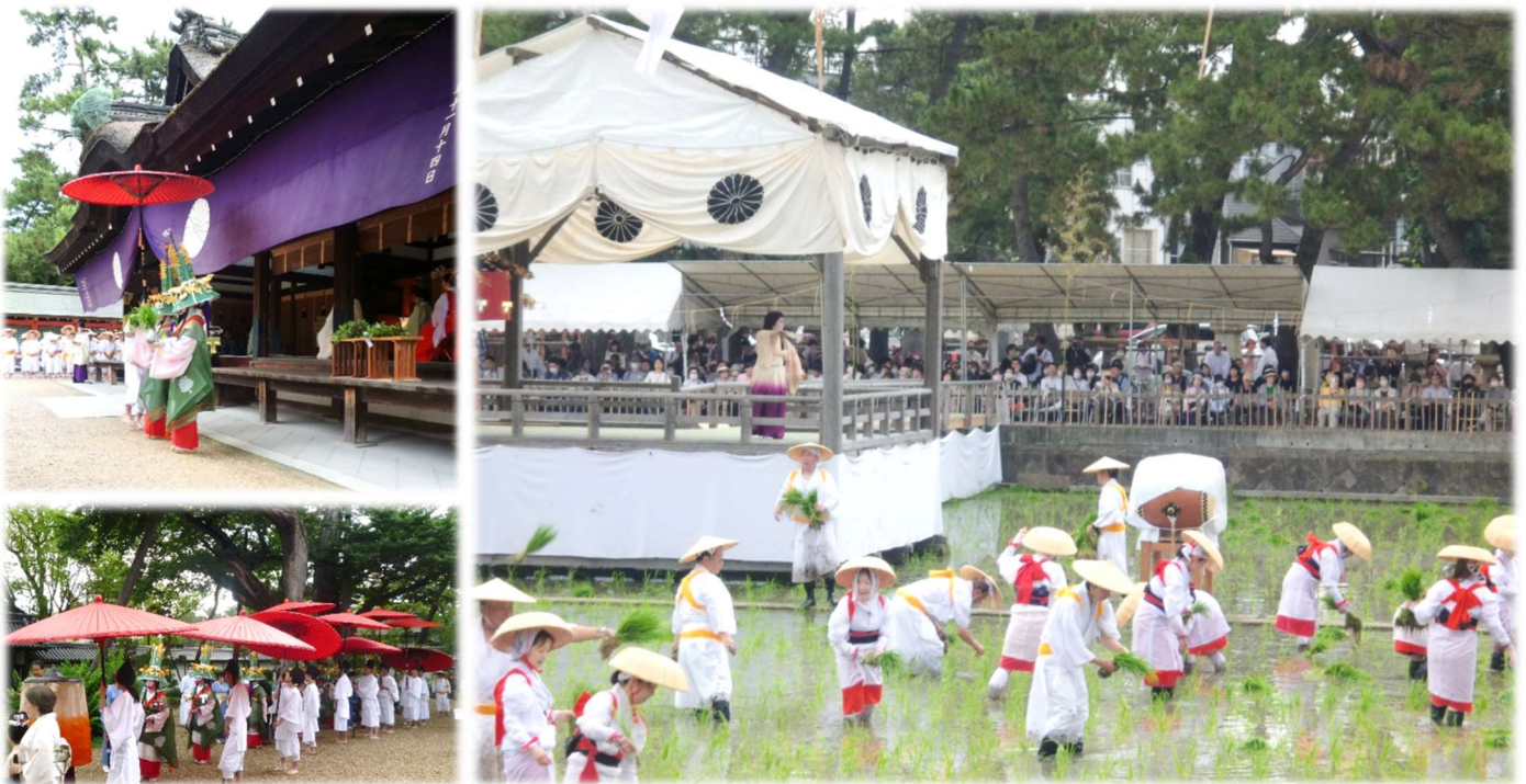
大阪学習センター開設面接授業「住吉大社御田植神事」2023年6月14日(水)