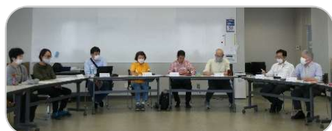
質問に答える先輩学生

6月17日（土）14時からセミナー室において、放送大学での学生生活を先輩学生がサポートする学習支援の集いを開催しました。当日は新入学生及び在学学生12名が参加され、科目選択について、単位認定試験対策、卒業研究や大学院進学についてといった様々な質問に対し、先輩学生5名からの的確なアドバイスがありました。