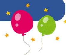
表 彰 式: 実施形態及び日時については現在検討中です。