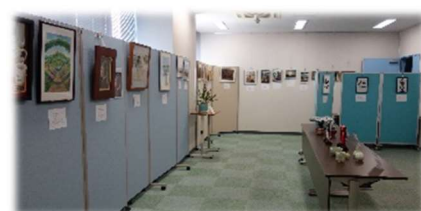
前回の美術展の様子