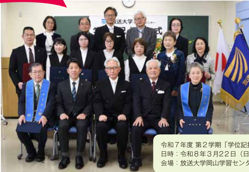
令和7年度 第2学期 「学位記授与式」 日時：令和8年3月22日（日）13：30～ 会場：放送大学岡山学習センター6F 第2講義室