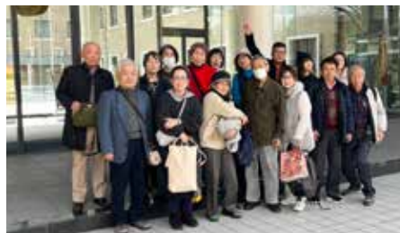
令和8年2月6日 酒類総合研究所見学の様子

これまで5年間「お酒」「発酵食品」「応用微生物学」「ビタミン」などについて学んできましたが、今年は原点に立ち返り、微生物や微生物を利用した様々な発酵にまつわる科学の話と一緒に楽しく学びたいと思います。