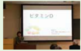
第2部 学生発表 ③ 山下 明美氏