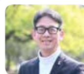
ほりうち たかし 堀内 孝 先生 岡山学習センター客員教授 岡山大学文学部教授 専門分野：社会心理学、認知心理学

からだを整えるホルモン入門 13:30~15:00 <全5回> ①4/8 ②6/17 ③7/29 ④8/19 ⑤9/16