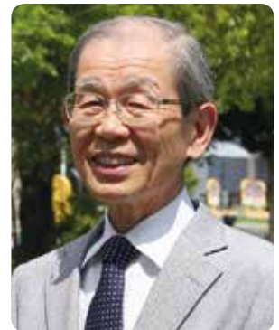
岡山学習センター客員教授