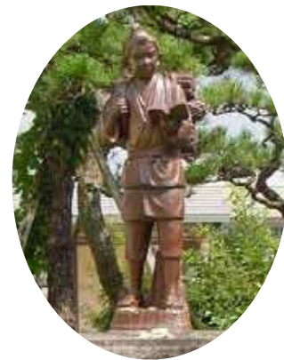
「備前焼の二宮金次郎像」

内容：戦前期、特に昭和初期に多くの小学校に二宮金次郎像が設置された。それ以前に展開された報徳運動との関連に注目しながら、設置の背景について考えてみる。岡山県は備前焼の産地であり、多くの像が備前焼で作られた。