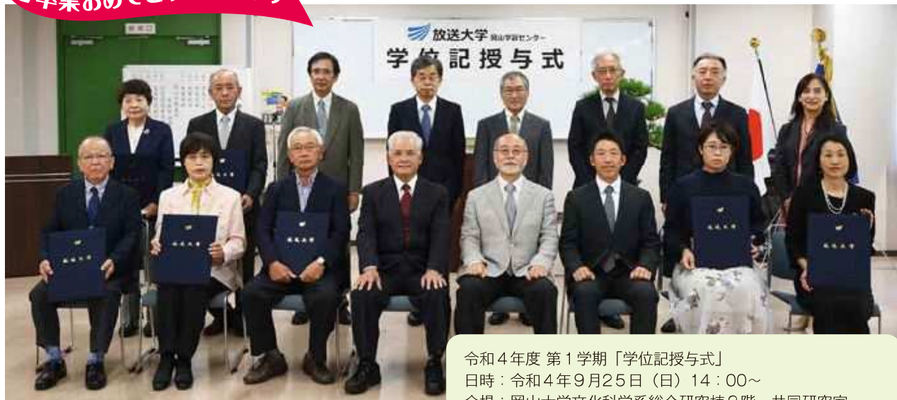
令和4年度 第1学期「学位記授与式」 日時：令和4年9月25日（日）14：00～ 会場：岡山大学文化科学系総合研究棟2階 共同研究室