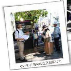
C35:旧石関町の近代建築にて

定員25名満席申込にて、多数の皆さまにご参加いただきました。ありがとうございました！