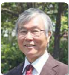
酒井 貴志 先生 (岡山大学名誉教授)

第5回 医療への応用(X線 CT, MRI, 超音波エコー, PET, 重粒子線治療など) 2/18(木) 10:30～12:00 第6回 電気自動車, 燃料電池車, リニア新幹線 3/10(木) 10:30～12:00