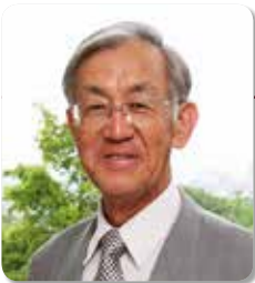
柘田 正治 先生 (岡山大学名誉教授)

第5回 因子分析 2/17(木) 13:30~15:00 第6回 まとめ 3/16(木) 13:30~15:00