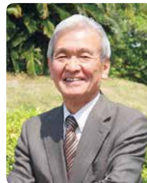
岡山学習センター所長