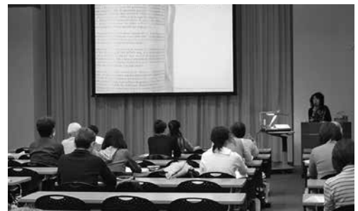
岡山県立図書館連携講座