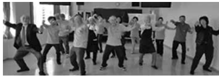
ハチハチクラブの太極拳演舞