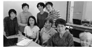
みんなで学ぶプロジェクトの オンライン授業「デモ版」実演