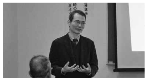
倉敷市立中央図書館連携講座