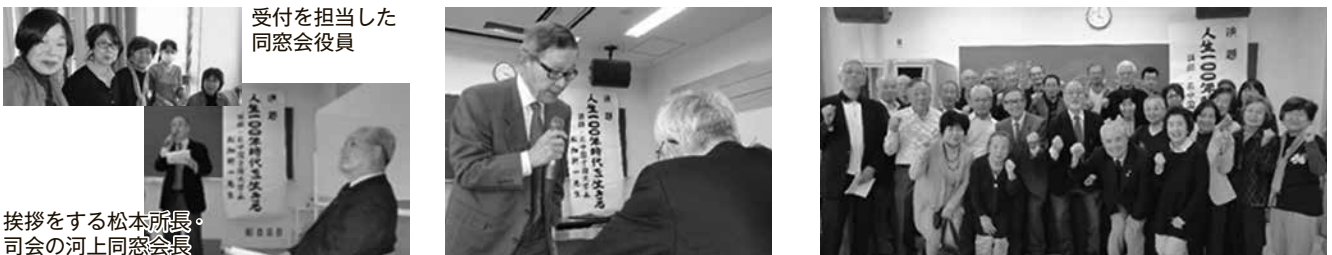
受付を担当した 同窓会役員