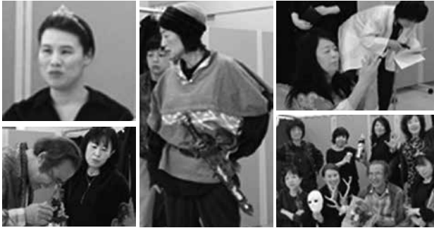
初代演劇同好会公演の出演者一同