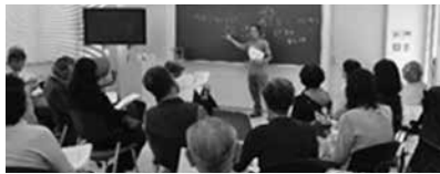
日常の心理クラブ・科学ワクワクラブ共同開催の発表会 (テーマ：認知行動科学)