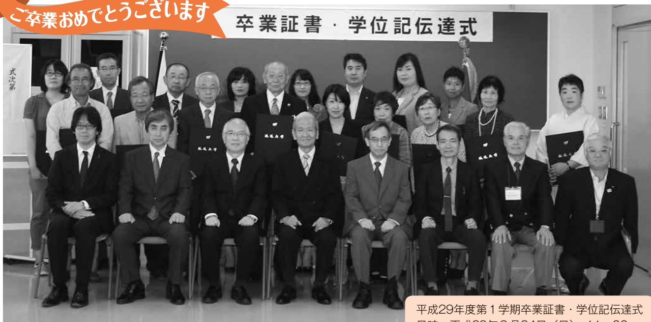
平成29年度第1学期卒業証書・学位記伝達式 日時：平成29年9月24日（日） 11：00～ 会場：岡山学習センター6階 講義室2