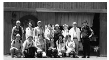
ハチハチクラブさんが企画した「丸亀うどんツアー」に参加し、讃岐うどんと骨付きどりを食して丸亀城に行きました。

遊ぶためだけではなく就職にも有利になりますよ。 会費は年1000円です。 クラブを楽しみましょう！