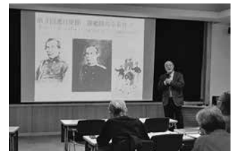
瀬戸内市民図書館連携講座の様子

2月5日（水）9：00から来館または、電話で受付を開始し、定員に達し次第終了させていただきます。