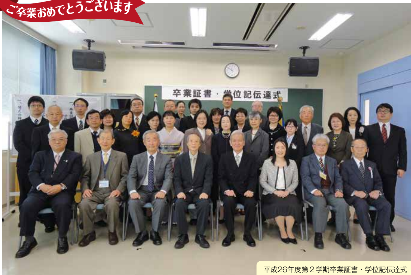
平成26年度第2学期卒業証書・学位記伝達式 日時：平成27年3月29日(日) 11:00～ 会場：岡山学習センター6階 講義室2