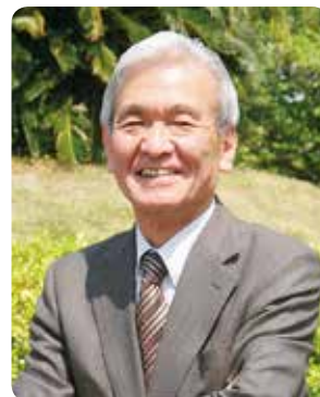
岡山学習センター所長