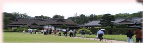
延養亭へ向かう道中