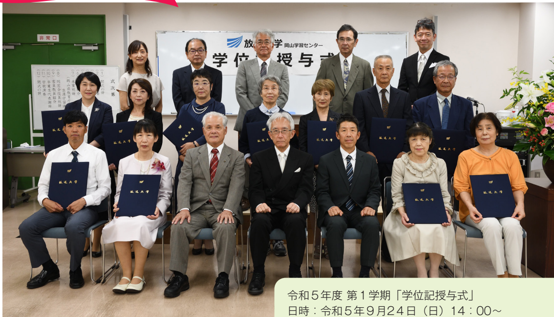
令和5年度 第1学期「学位記授与式」 日時：令和5年9月24日（日）14：00～ 会場：岡山大学文化科学系総合研究棟2階 共同研究室