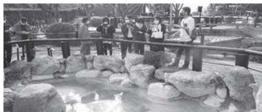
▲前回の巡検の様子