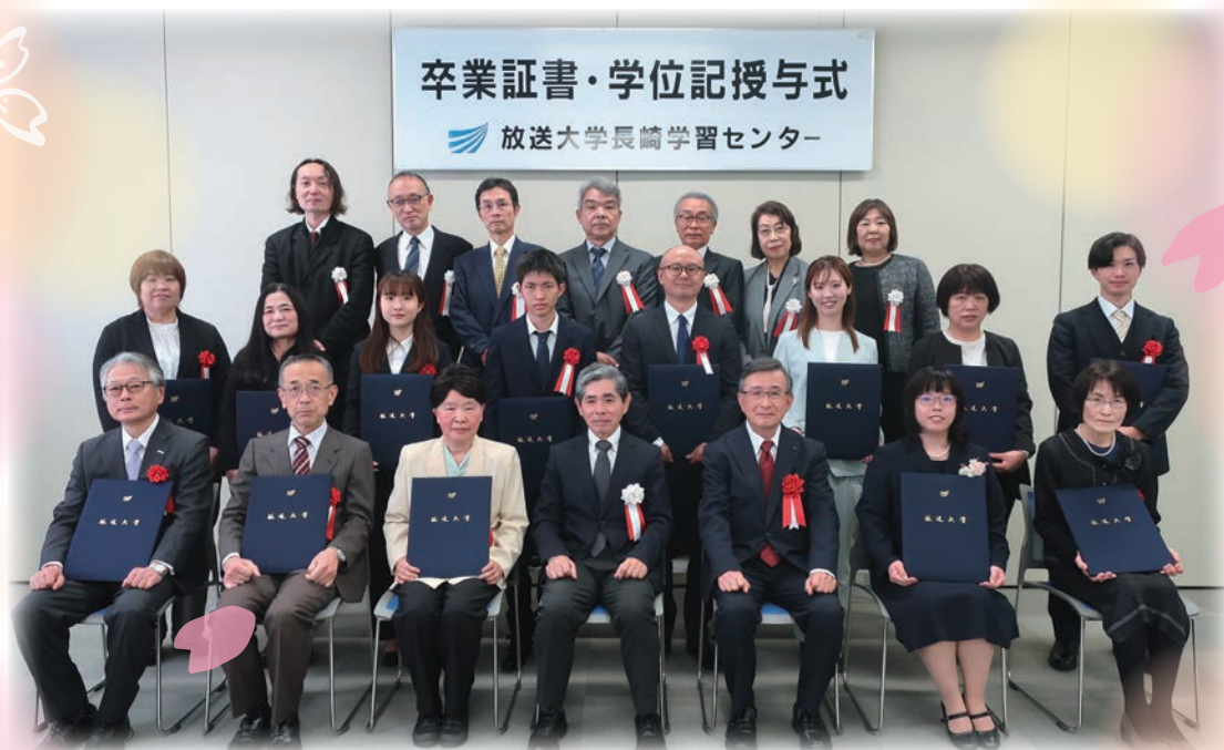
<2025年度 第2学期卒業の皆さん>

令和8年3月、放送大学では3,711名が卒業・修了されました。 そのうち長崎学習センターでは28名の方が教養学部を卒業されました。 また、今回の卒業で、4名の方が長崎学習センター特別表彰（3回卒業）を受けられました。心からお祝い申し上げます。