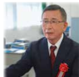
< 長崎学習センター特別表彰 >