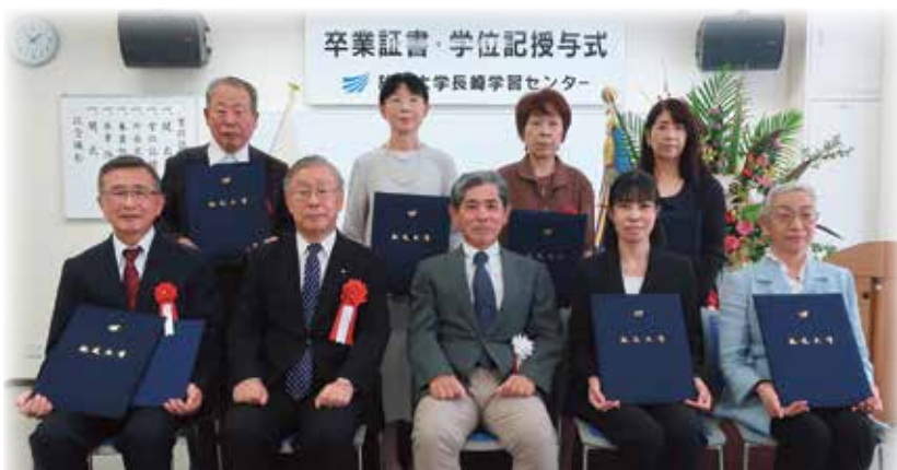
< 2023年度第1学期卒業の皆さん >

2023年9月、放送大学では2,262名が卒業・修了されました。 そのうち長崎学習センターでは22名の方が教養学部を卒業されました。 また、今回の卒業で1名の方が名誉学生の称号を得られ、2名の方が長崎学習センター特別表彰を受けられました。心からお祝い申し上げます。