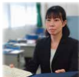
< 学位記授与 >