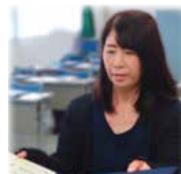
< 学位記授与 >