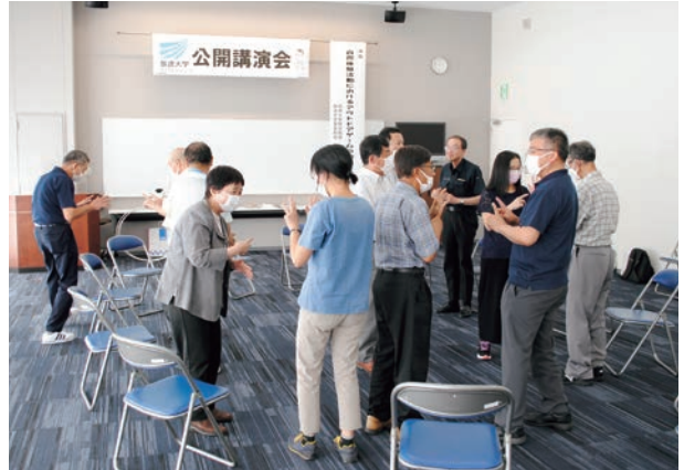
アウトドアゲームの様子