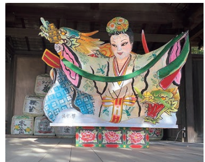
諏訪市手長神社 龍と巫女の迎春ねぶた

春の到来を少し感じつつ、気候変動の影響か、雪やみぞれが降ったりと、毎日気候の変化を体を感じながら過ごす、今日この頃です。