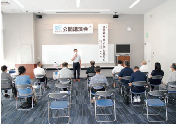
最初の講師紹介挨拶