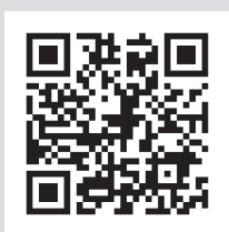
システム WAKABA シラバス検索