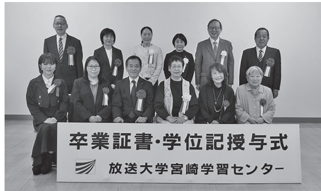
2025年度第2学期卒業生の皆様