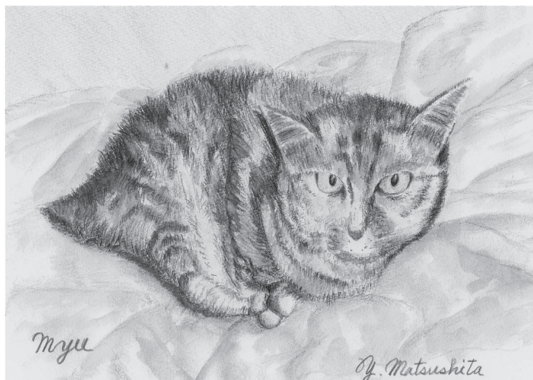
所長の家のネコ“Myu”(4人姉妹の末っ子娘です、カラーで見てもらいたかったネ！)