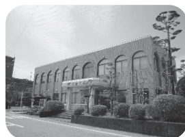
放送大学 宮崎学習センター