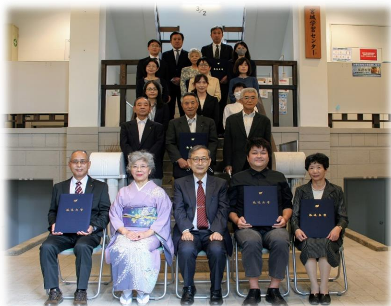
エントランスにて記念撮影（撮影時のみマスクを外しています）

感染症対策のため、所長から卒業生への直接の授与は行わず、縮小した形での式となりましたが、皆様のご卒業を一緒にお祝いし、晴れやかなお顔を拝見することができ、職員一同大変嬉しく思いました。