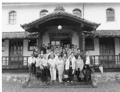
開明学校の前で記念撮影