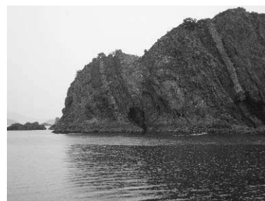
須崎海岸沖の黒瀬川構造帯