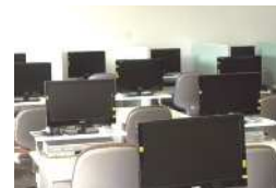
視聴学習室(イメージ)