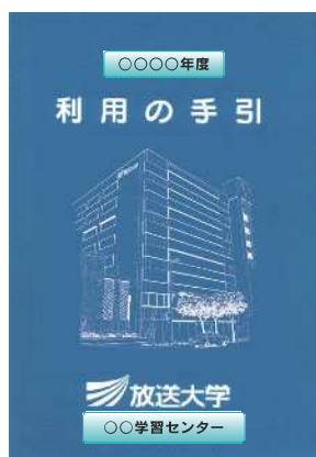
利用の手引イメージ写真

「学生生活の栞(電子版)」は、電子データ(PDF)で提供されており、学習する上で必要な情報や、スケジュール、手続き等が記載されています。必ず、一度、目を通してください。 ※ 各種届の様式が巻末にあります。