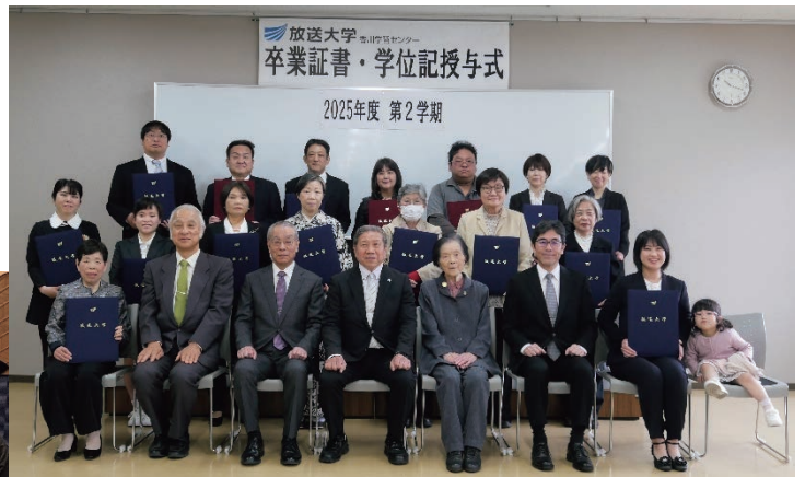
◆R8.3.29(日) 卒業生と来賓、所長、客員教員 (香川学習センター)