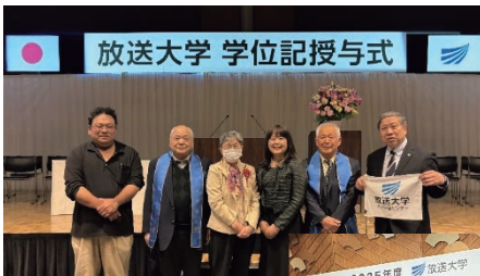
◆R8.3.20(金) ベルサール高田馬場 (東京)にて