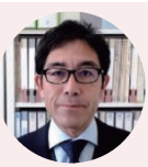
上野 耕平 客員教授 体育科学 香川大学教育学部教授