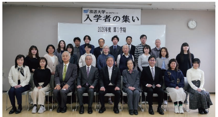
◆R8.3.29(日) 新入生と来賓、所長、客員教員

その後は、所長と卒業生、新入生を囲んでの昼食懇談会を開き、和やかな交流のひとつときを持ちました。サークル活動の紹介も行われ、笑顔あふれる温かな会となりました。