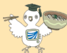
放送大学香川学習センター マスコットキャラクター 「マナビー」

※開所時間: 9:30~17:30 ※閉所日: 月・火(4月~6月、10月~12月) 日・月(7月~9月、1月~3月) 祝日、年末年始