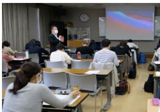
面接授業(スクーリング)

香川大学(幸町北キャンパス)内にあり、研究交流棟の最上階7~8階に位置しています。南は紫雲山や峰山、北は女木島や屋島、美しい瀬戸内海の景観を望み、快適で充実した学習環境です。さまざまな年代や職業の約650の方が在籍し、意欲的に学んでいます。