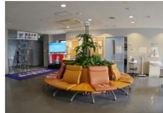
学生休憩コーナー