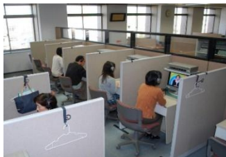
視聴学習室・図書室・PC学習室