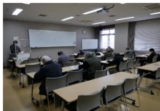
特別セミナー(学内学習会)