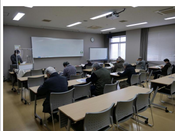
特別セミナー(学内学習会)