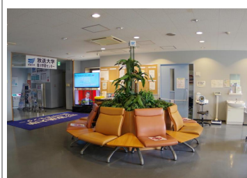
学生休憩コーナー