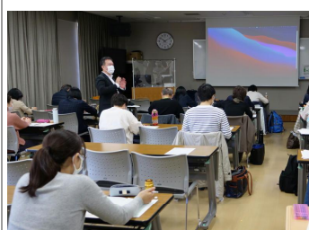
面接授業(スクーリング)

香川大学(幸町北キャンパス)内にあり、研究交流棟の最上階 7 ～ 8 階に位置しています。南は紫雲山や峰山、北は女木島や屋島、美しい瀬戸内海の景観を望み、快適で充実した学習環境が自慢です。さまざまな年代や職業の約 650 名の方が在籍し意欲的に学んでいます。