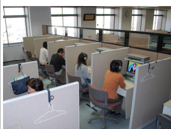
視聴学習室・図書室・PC学習室