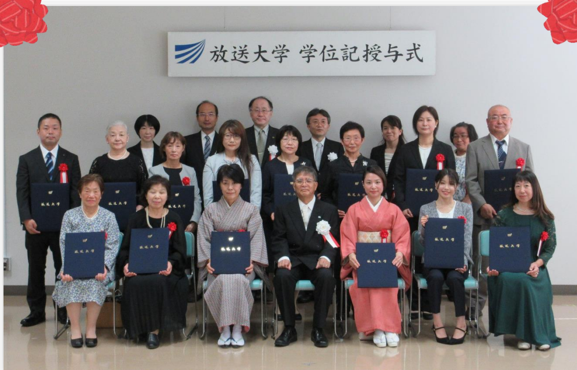
～学位記授与式に出席された卒業生の方々～

9月24日（日）、岩手学習センターにて「2023年度第1学期学位記授与式」が行われ、岩手学習センターからは教養学部31名が卒業されました。教職員一同、心よりお祝い申し上げます。