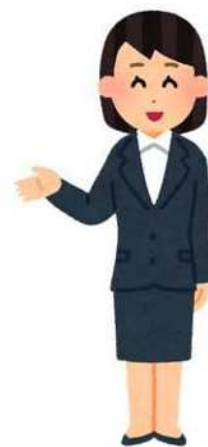
学習センターホームページ

https://www.sc.ouj.ac.jp/center/hokkaido/