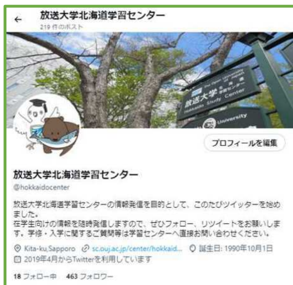
X（北海道学習センター） https://twitter.com/hokkaidocenter

https://www.sc.ouj.ac.jp/center/hokkaido/