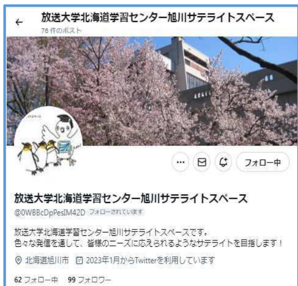
X（旭川サテライトスペース） https://twitter.com/OWBBcDpPesIM42D